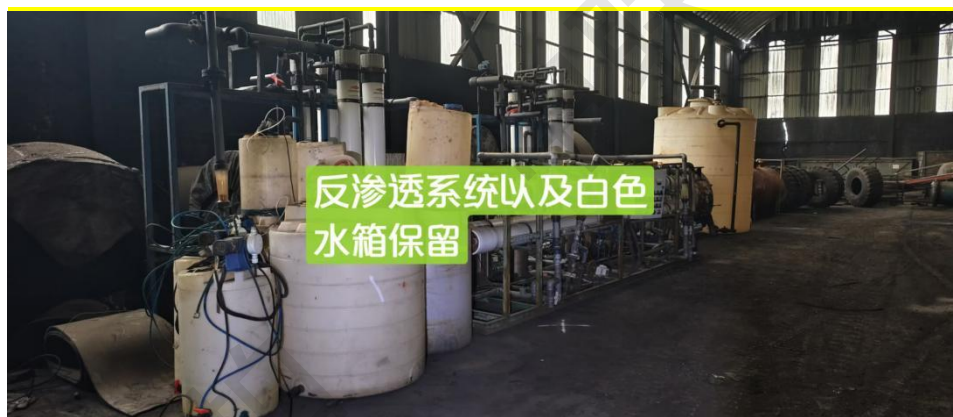
反渗透系统以及白色 水箱保留