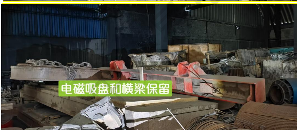
电磁吸盘和横梁保留