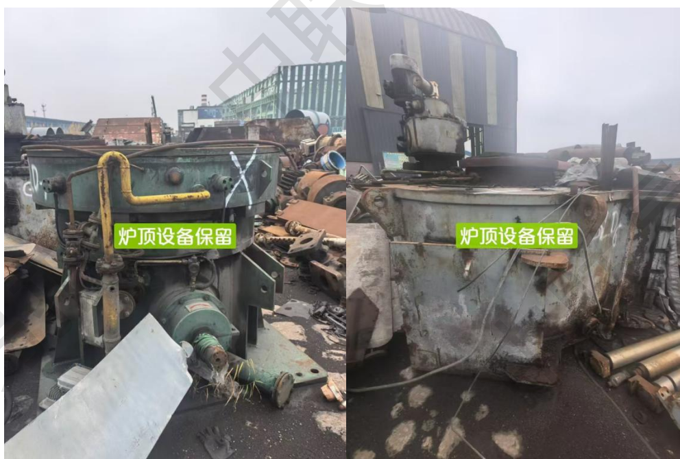
竖炉棚北侧场地物资：