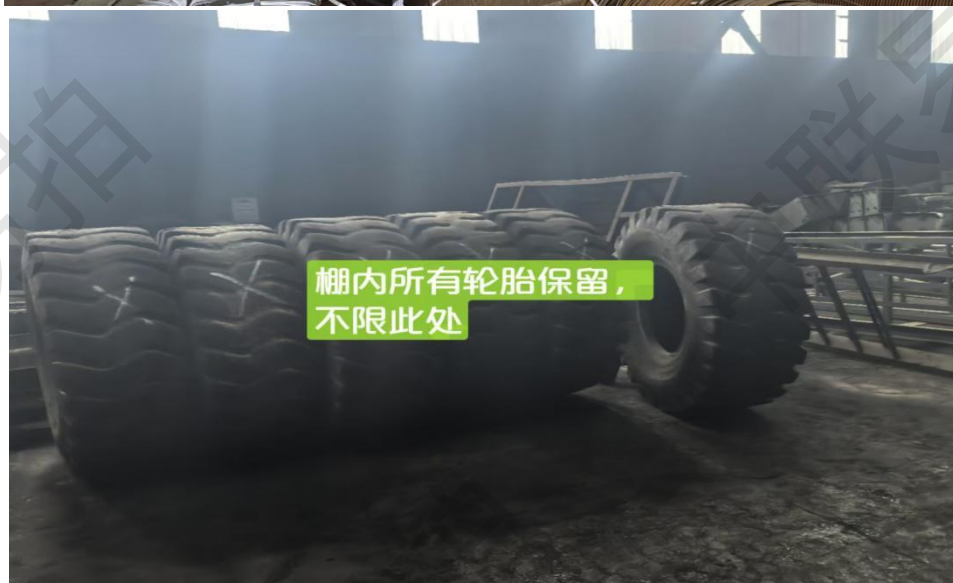
棚内所有轮胎保留， 不限此处