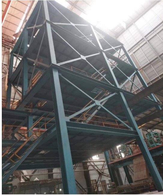
年产 15 万吨镀锌板生产线高平台