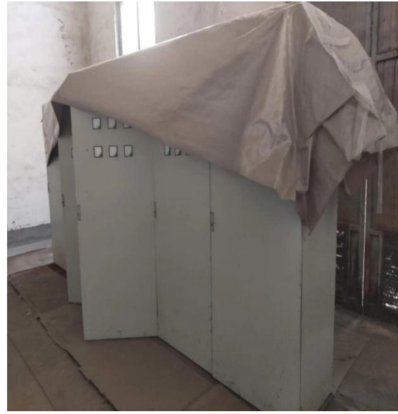
年产 15 万吨镀锌板生产线附属配套设备