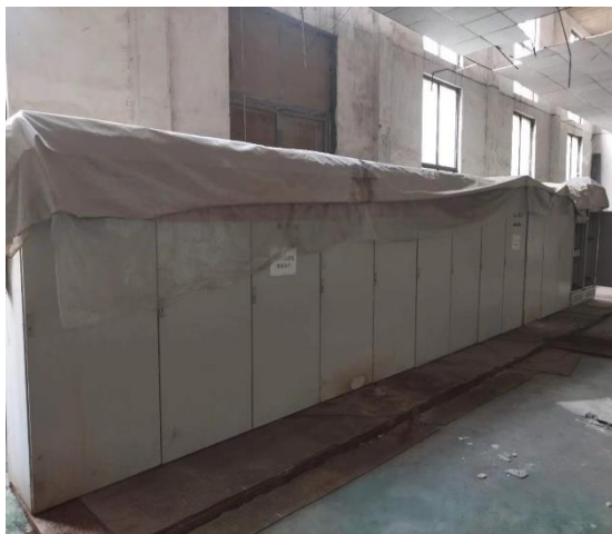
年产 15 万吨镀锌板生产线控制柜