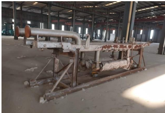
年产 15 万吨镀锌板生产线附属配套设备