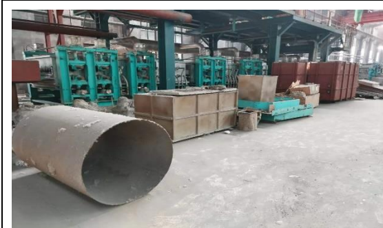
年产 40 万吨镀锌板生产线附属配套设备