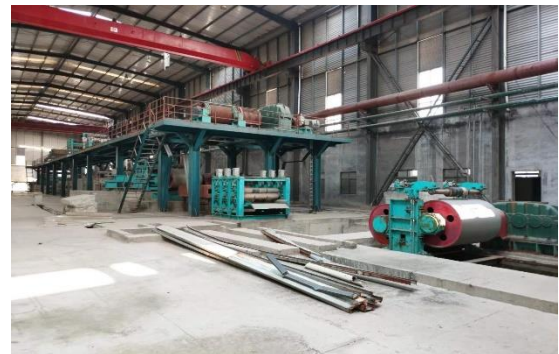
年产 40 万吨镀锌板生产线