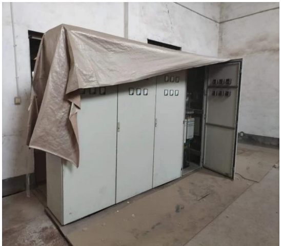
年产 15 万吨镀锌板生产线控制柜