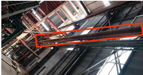
年产 40 万吨镀锌板生产线厂房内通风管道