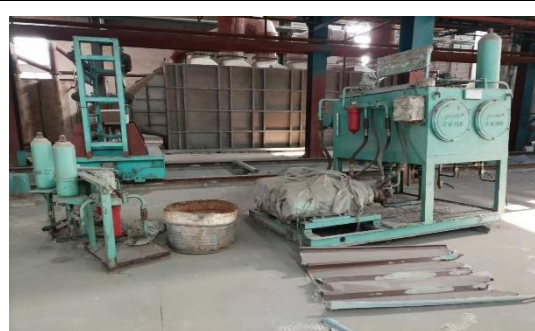
年产 40 万吨镀锌板生产线附属配套设备