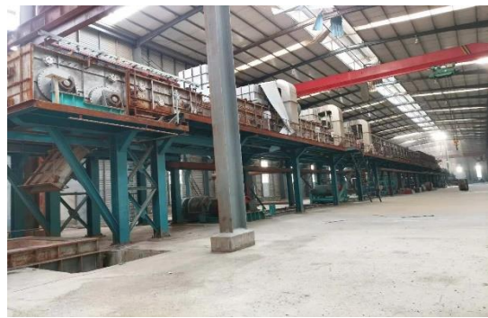
年产 40 万吨镀锌板生产线