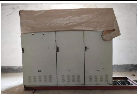
年产 40 万吨镀锌板生产线厂房内配电柜