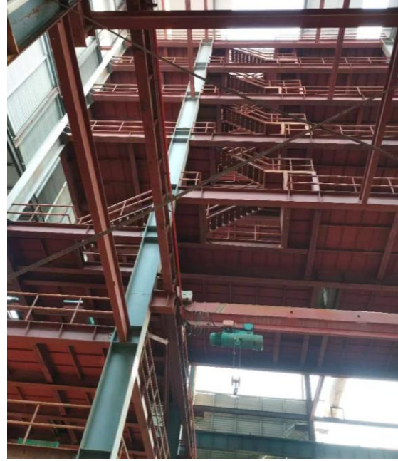
年产 40 万吨镀锌板生产线高平台