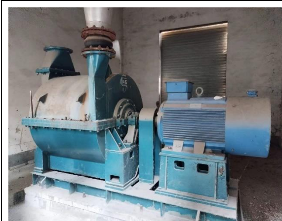
年产 40 万吨镀锌板生产线附属配套设备