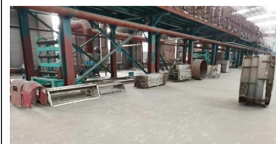
年产 40 万吨镀锌板生产线附属配套设备