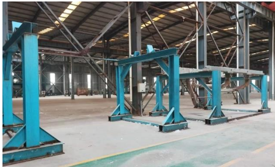
年产 15 万吨镀锌板生产线附属配套设备