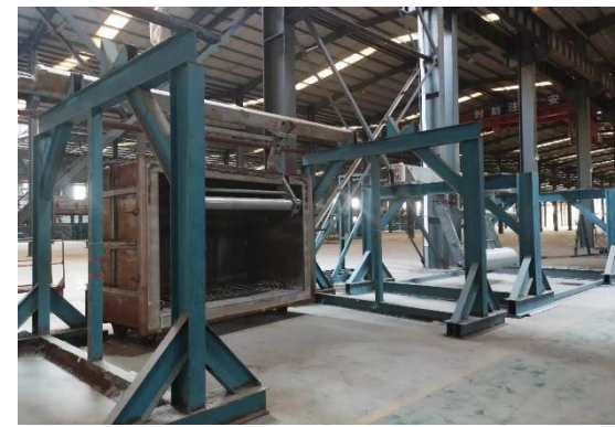
年产 15 万吨镀锌板生产线附属配套设备