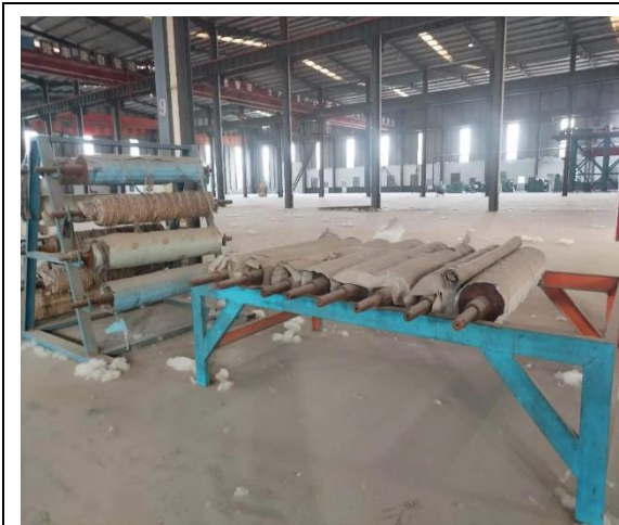
年产 15 万吨镀锌板生产线附属配套设备