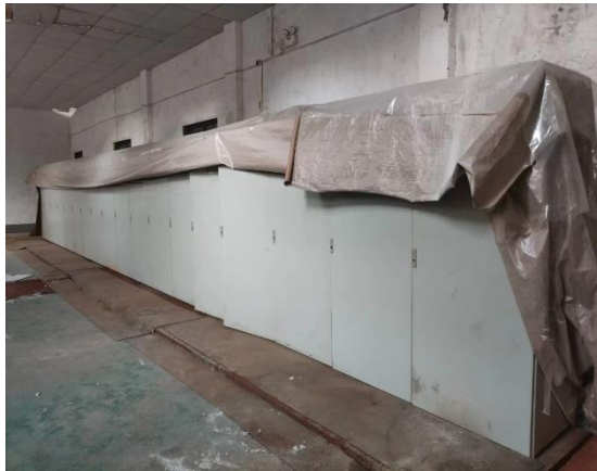
年产 15 万吨镀锌板生产线控制柜