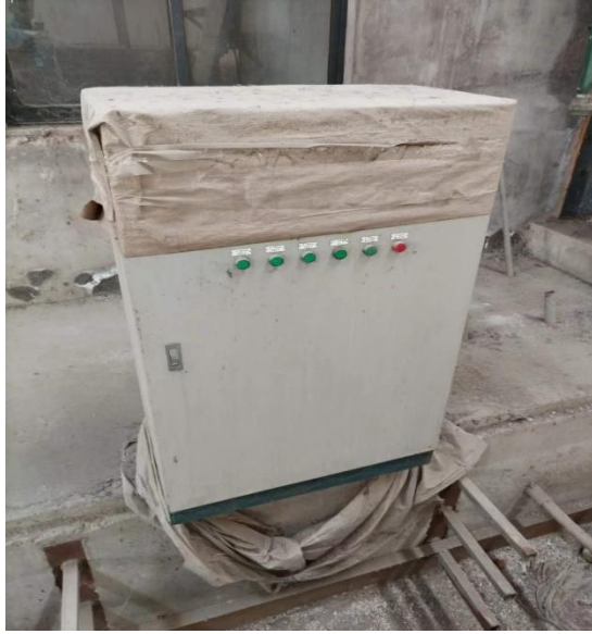
年产 40 万吨镀锌板生产线厂房内配电柜