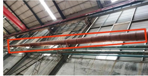
年产 15 万吨镀锌板生产线厂房内通风管道

以上镀锌板生产线设备及附属设备设施、控制柜、通风管道、柴油发电机等物资为外售范围。