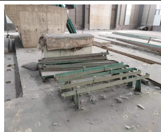
年产 40 万吨镀锌板生产线附属配套设备