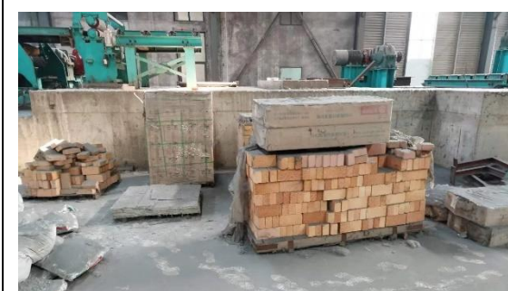
年产 40 万吨镀锌板生产线附属配套设备