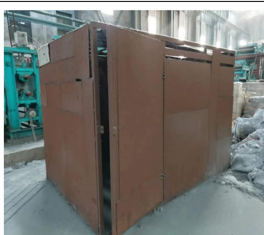
年产 40 万吨镀锌板生产线附属配套设备