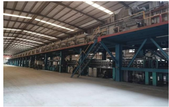
年产 40 万吨镀锌板生产线