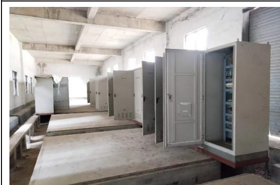
年产 40 万吨镀锌板生产线控制柜