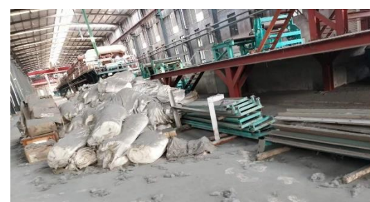
年产 40 万吨镀锌板生产线附属配套设备