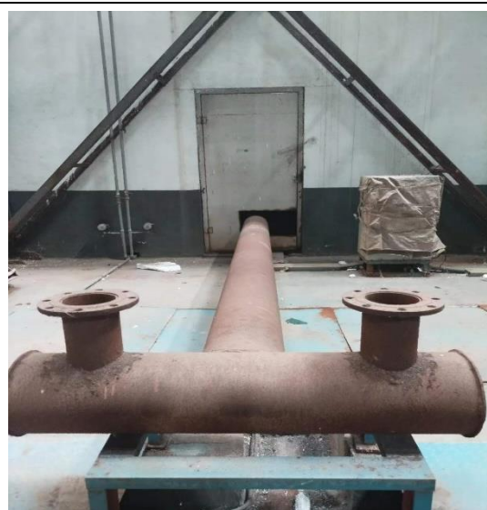
气刀室设备及管道