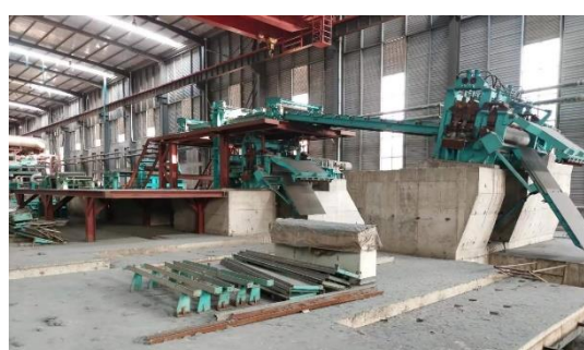
年产 40 万吨镀锌板生产线