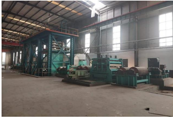
年产 15 万吨镀锌板生产线