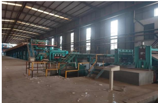
年产 15 万吨镀锌板生产线