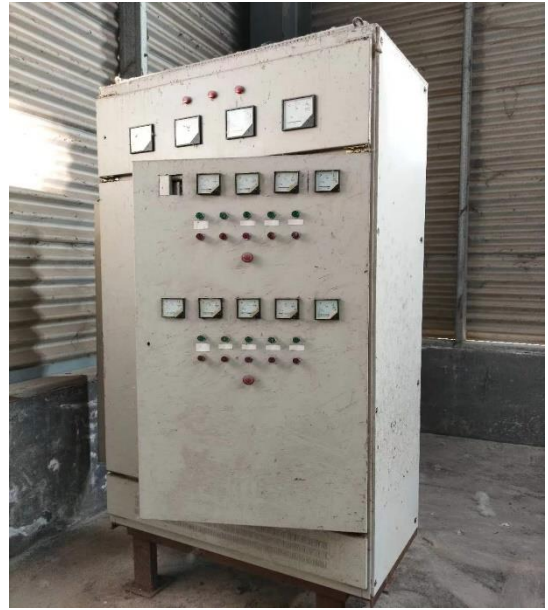
年产 40 万吨镀锌板生产线厂房内配电柜