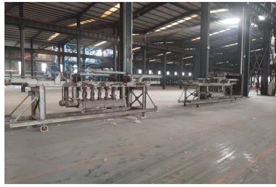
年产 15 万吨镀锌板生产线附属配套设备