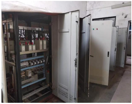
年产 15 万吨镀锌板生产线控制柜