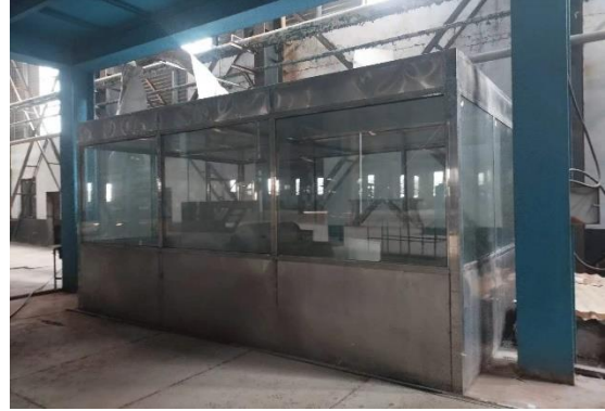
年产 15 万吨镀锌板生产线操作室